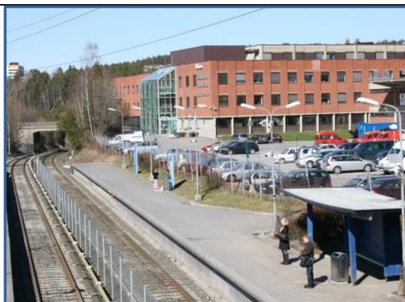
Olaf Helsets vei 5