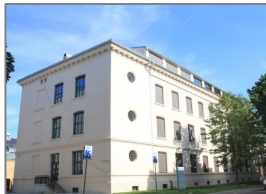
Osterhaus' gate 22